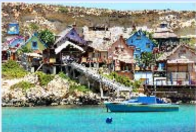
2° prix: Popeye Village - Malte Bruno ROYAUX