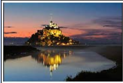
1° prix: Mont -St-Michel - La merveille de l'occident Didier KEUS