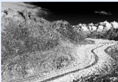
3° prix: Aletsch Didier KEUS

Le Photo-Club vous invite déjà à ses prochains rendez-vous: