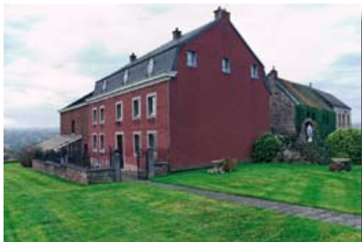
Large et profonde habitation en briques et calcaire sur soubassement de moellons cimenté.