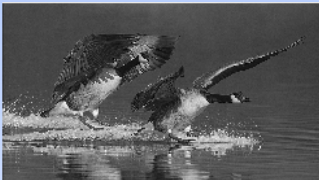
1° prix: Les bernaches Laurent DECLoux